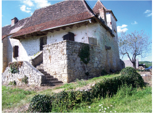
Eglise de Loudour