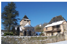
Mairie et Église