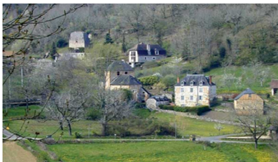
Village de « Valeyrac »