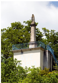
Notre Dame des Neiges